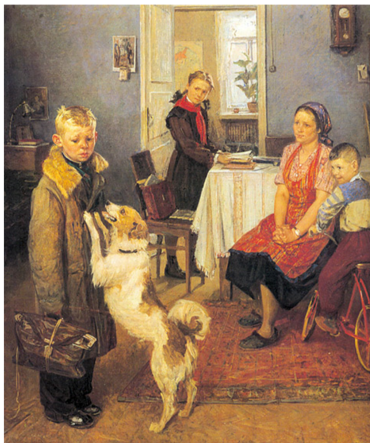
Опять двойка. Художник Фёдор Павлович Решетников. 1952.

37. Какой метод семейного воспитания отражен на картине Ф. Решетникова «Опять двойка»?