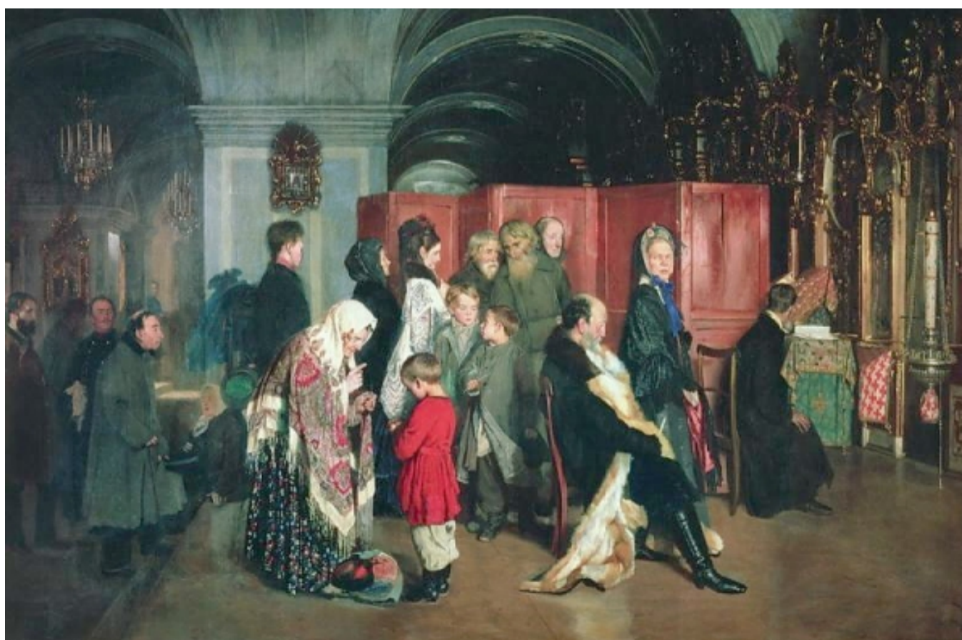
Перед исповедью. Художник Алексей Иванович Корзухин. 1876–1877.

38. Какой метод семейного воспитания отражен на картине А. Корзухина «Перед исповедью»?