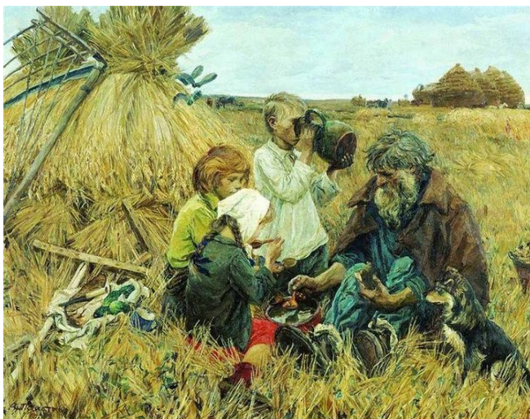
Жатва. Художник Аркадий Александрович Пластов. 1945.

41. Какие задачи семейного воспитания отражены на картине А. Пластова «Жатва»? (см. приложение 4)