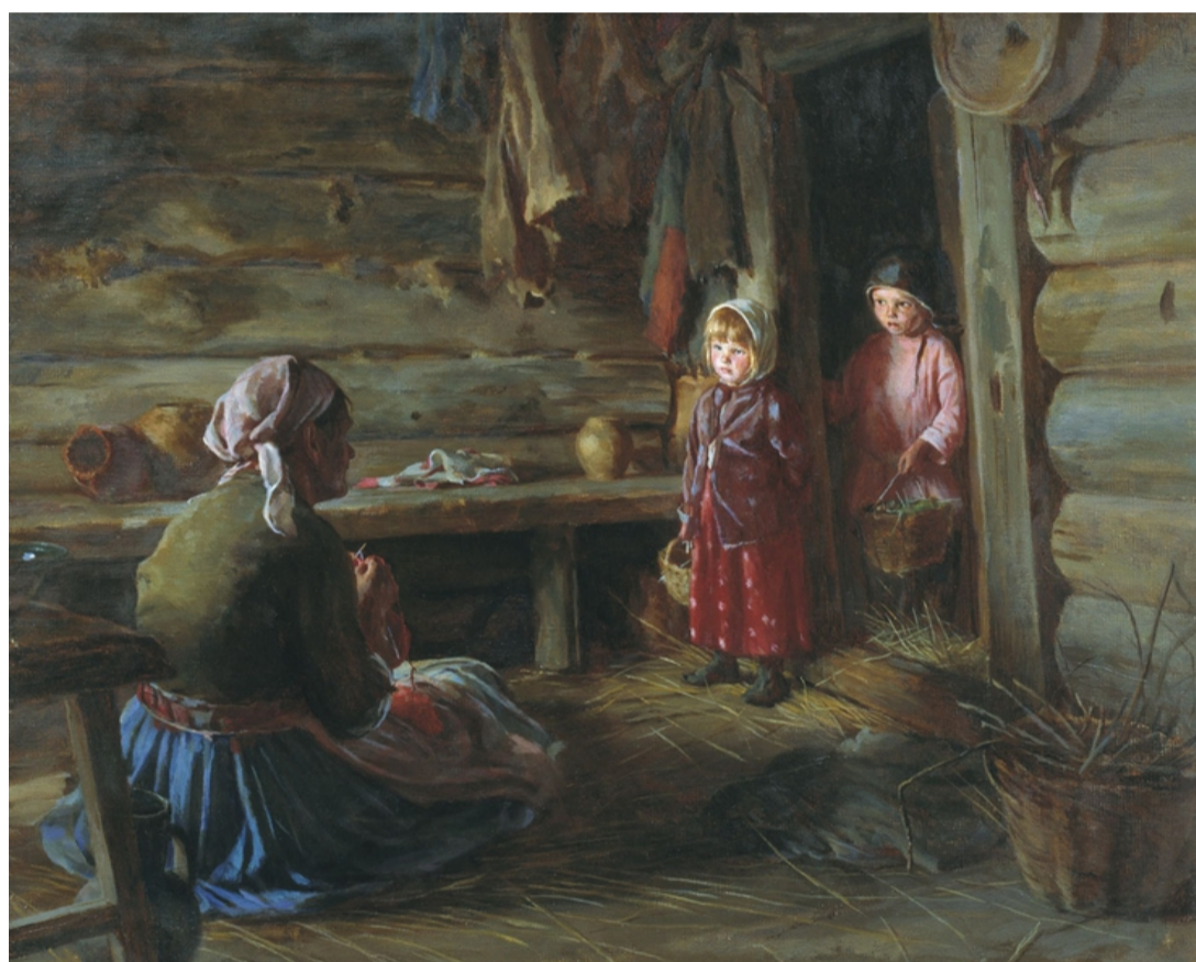
Где болтались? Художник Кирилл Викентьевич Лемох. 1897.

43. Какой метод семейного воспитания отражен на картине К.В. Лемоха «Где болтались?»?