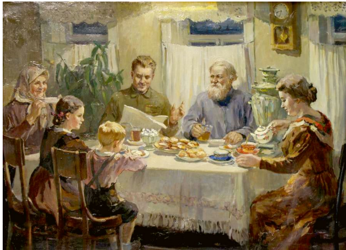
За обедом. Художник Василий Степанович Баюскин. 1950.

42. Какие принципы семейного воспитания отражены на картине В.С. Баюскина «За обедом»?