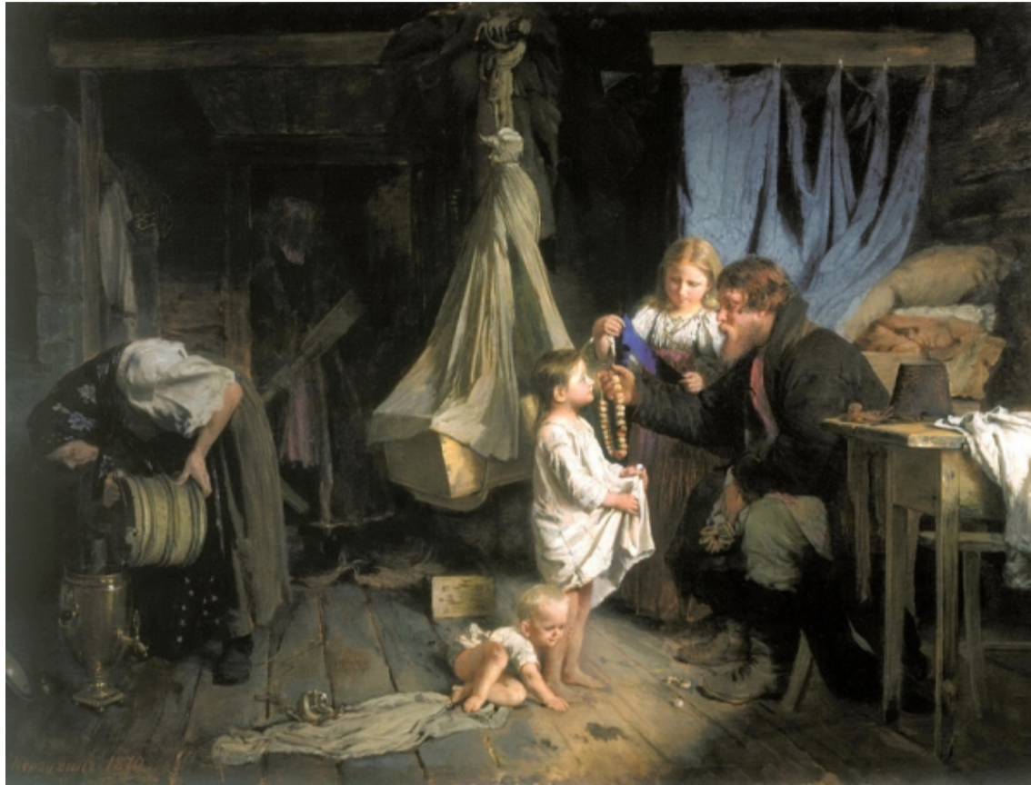
Возвращение из города. Художник Алексей Иванович Корзухин. 1870.

39. Какой метод семейного воспитания отражен на картине А. Корзухина «Возвращение из города»?