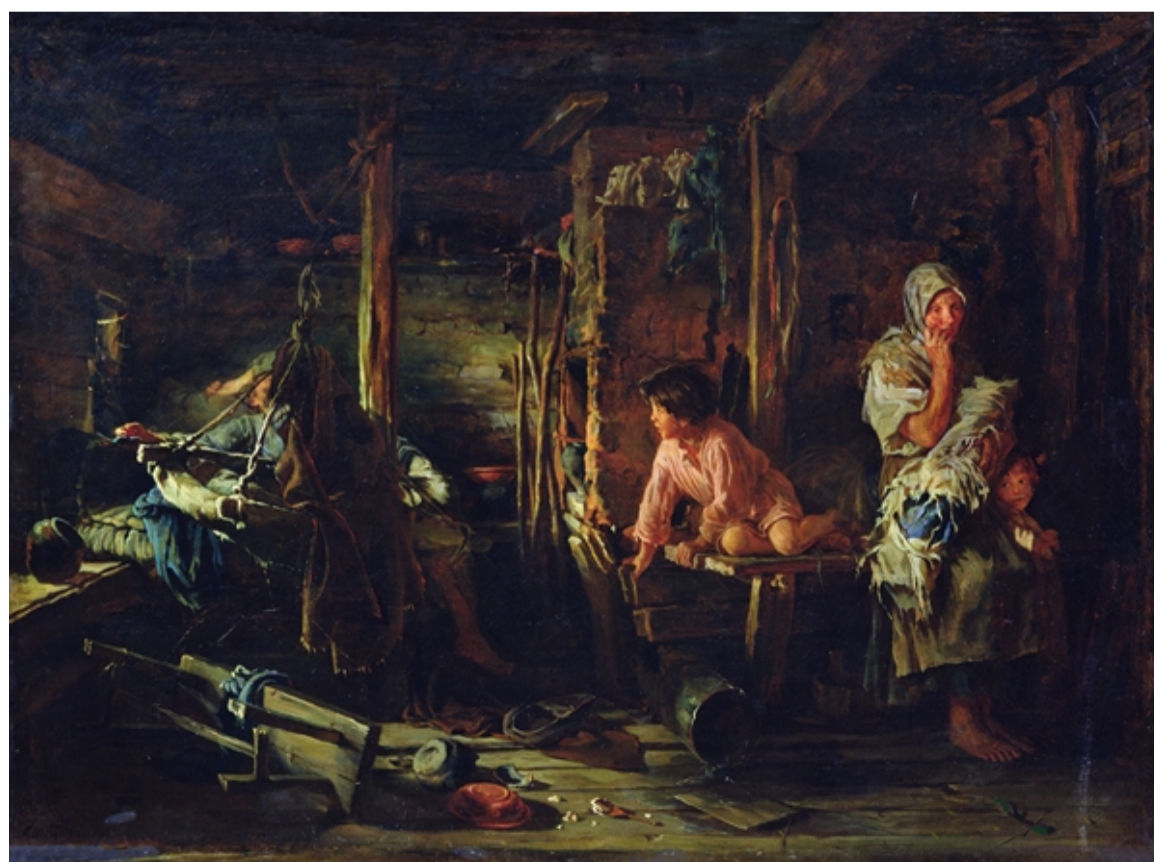
Пьяный муж. Художник Кирилл Викентьевич Лемох. 1894.

44. Как проблемы, отраженные на картине К.В. Лемоха «Пьяный муж», сказываются на функциях семьи?