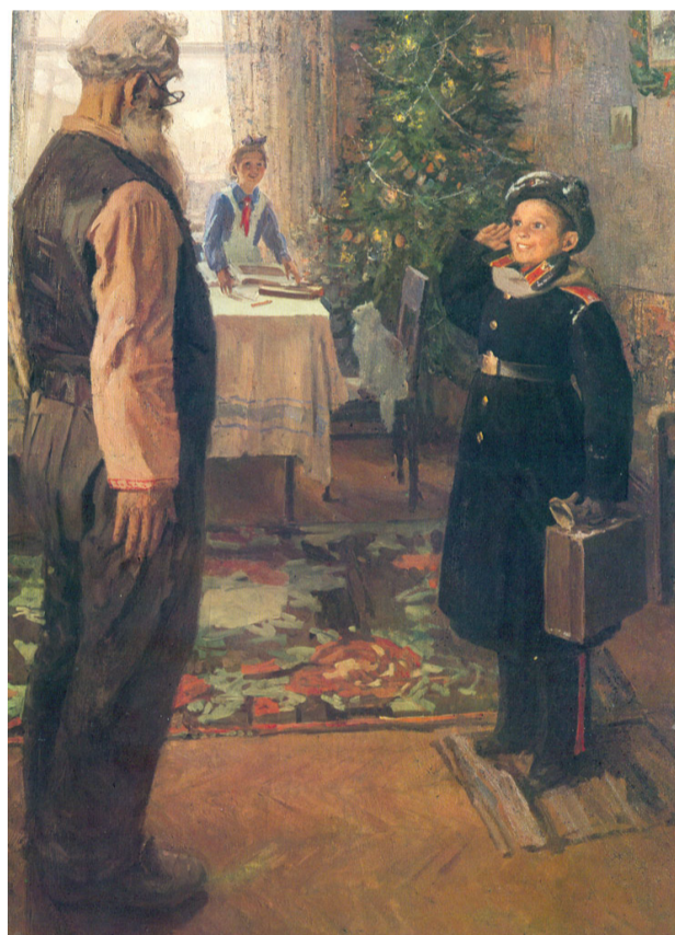
Прибыл на каникулы. Художник Фёдор Павлович Решетников. 1948.

40. Какие условия воспитания в семье отражены на картине Ф. Решетникова «Прибыл на каникулы»?